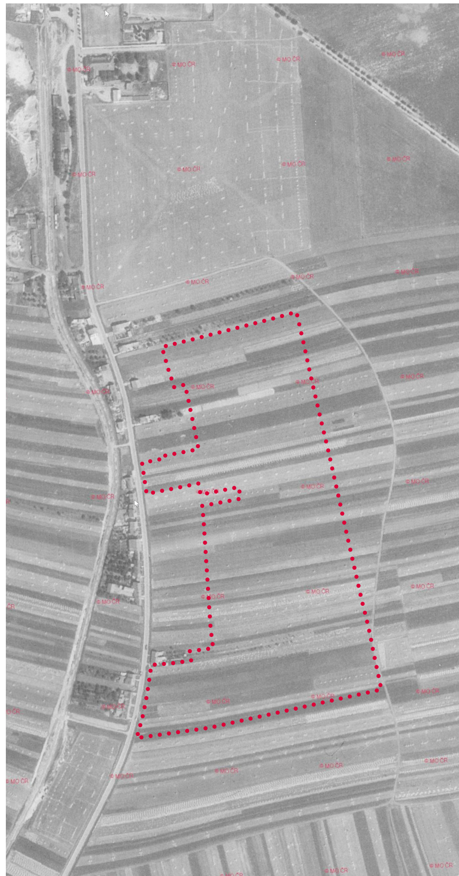
letecký snímek z roku 1947