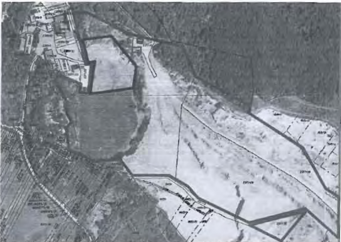
Cervený polygon – pozemky v majetku ZO ČSOP Pozemkový spolek Hády na území města Brna Černý polygon – plocha požadované změny na kategorii Plocha lehké výroby - E

Vymezte v lokalitě lomu Hády plochu E místo plochy K v k.ú. Maloměřice při ul. Hády v návaznosti na stávající areál E/v2 vymezený dle var. II v rozsahu dle graf. přílohy námítky, upravte rozsah režimu ÚSES.