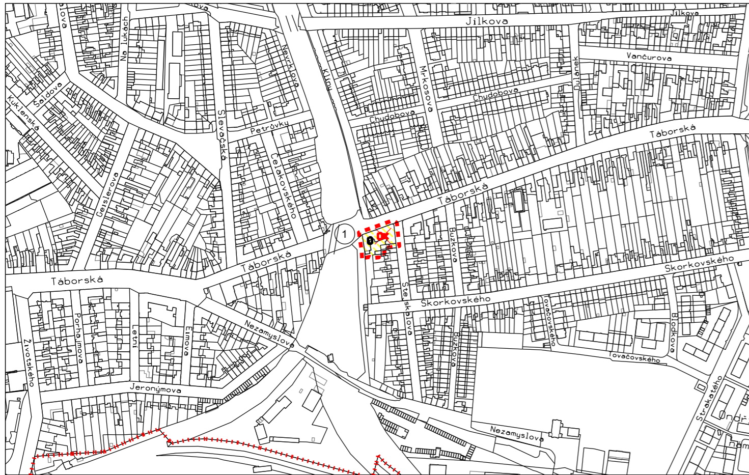
B342_p159_22y - Táborská - železniční viadukt II MČ Brno-Židenice, k.ú. Židenice (611115)