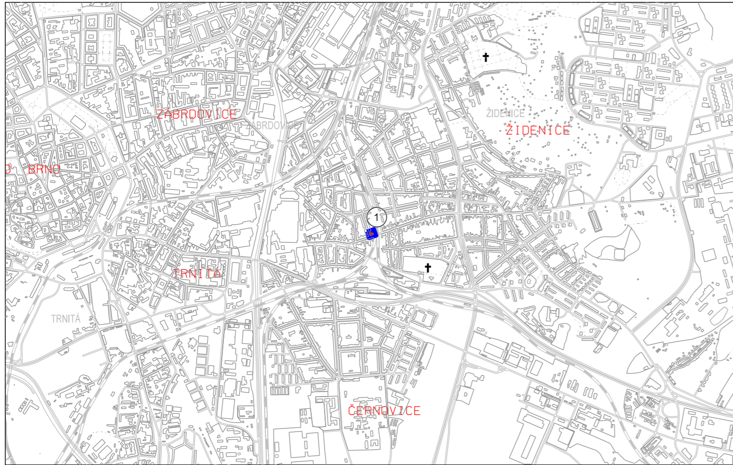
B342_p159_22x - Táborská - železniční viadukt I MČ Brno-Židenice, k.ú. Židenice (611115)