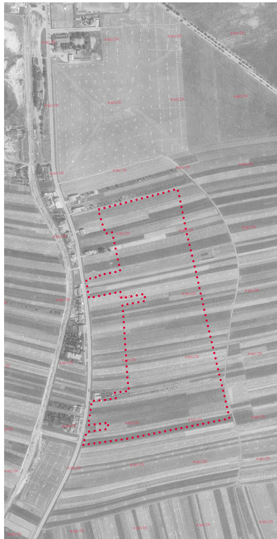
letecký snímek z roku 1947