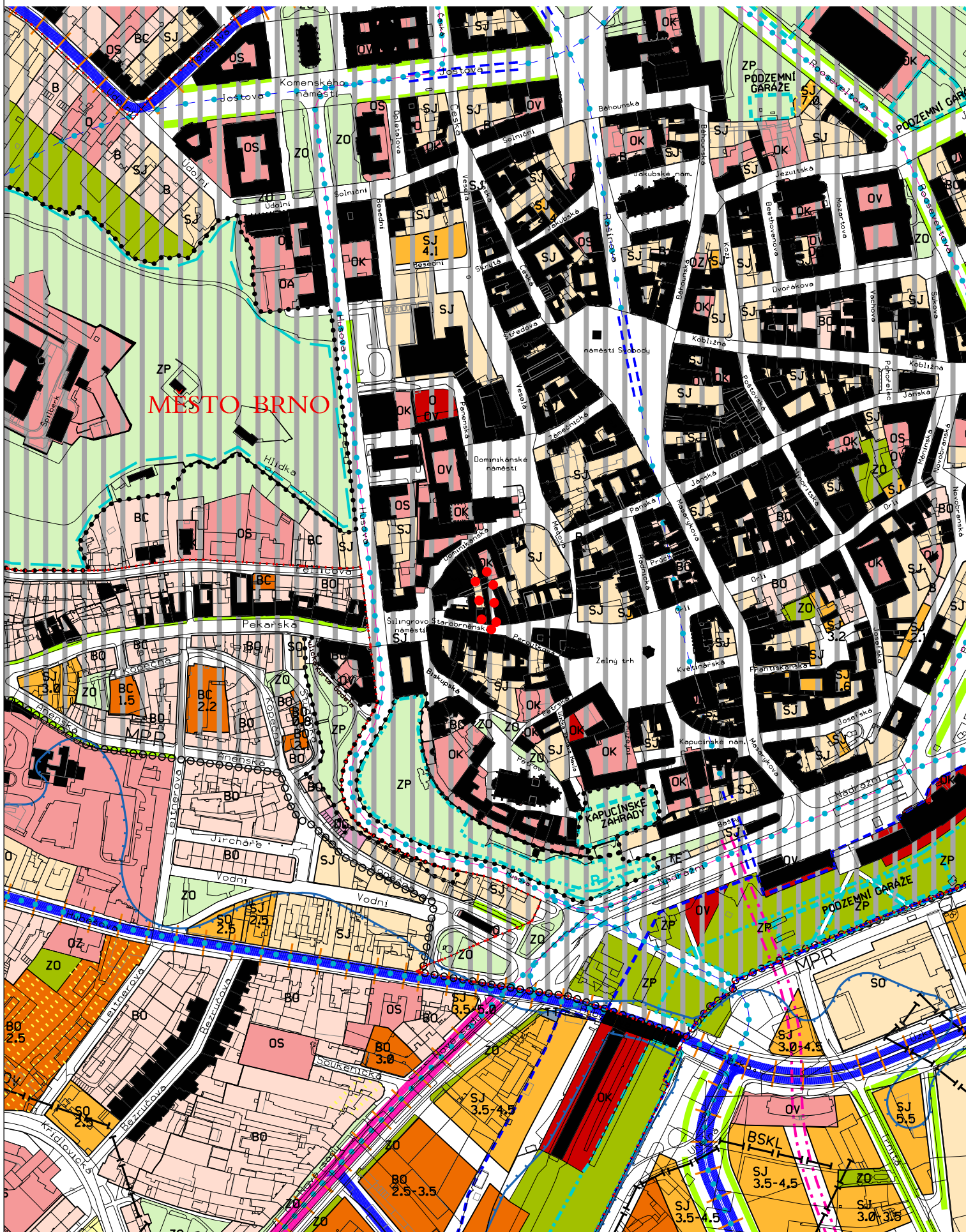
Územní plán města Brna platný k 17. 12. 2020 (výřez z doplňujícího výkresu Plán využití území - 1:5000)