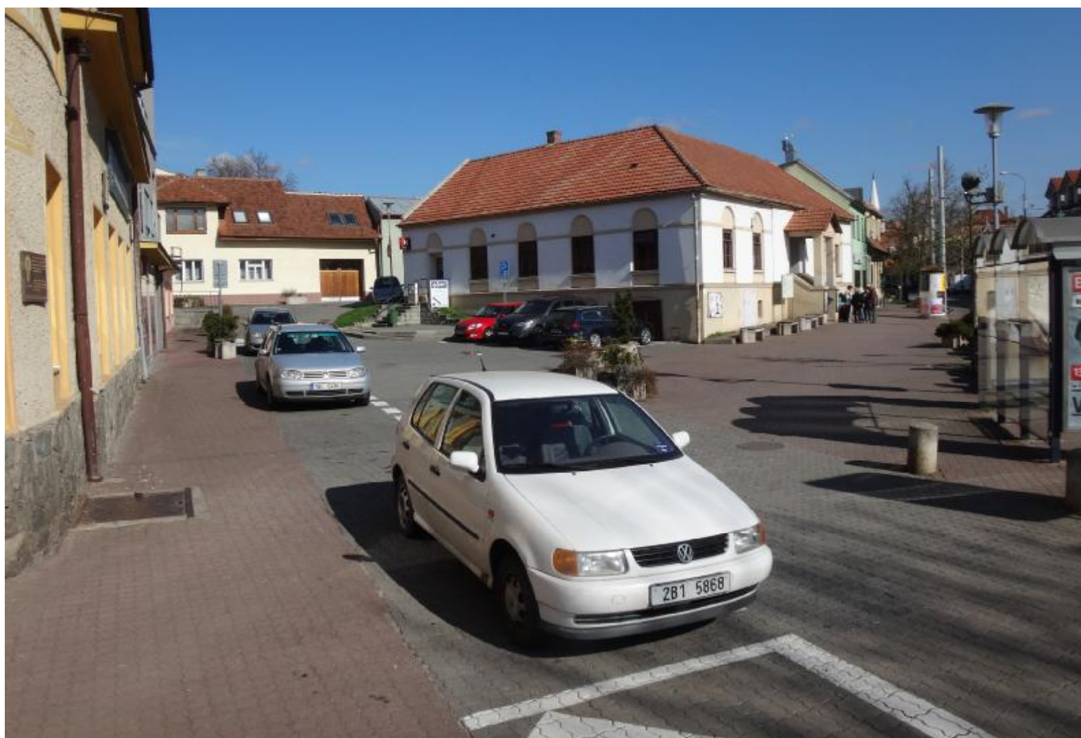
PERSPEKTIVA NÁMĚSTÍ - STAV