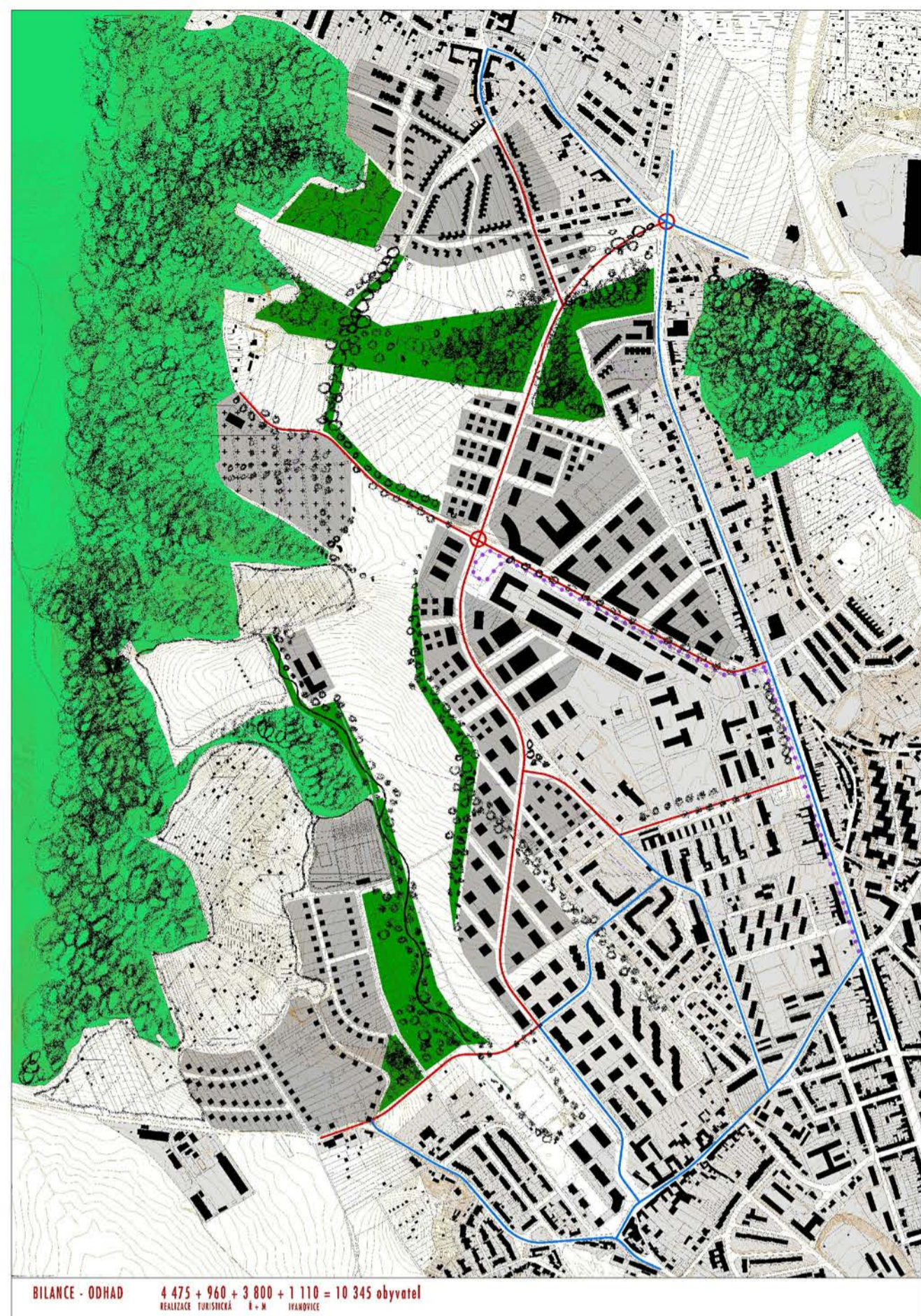
varianta A - prostorové uspořádání