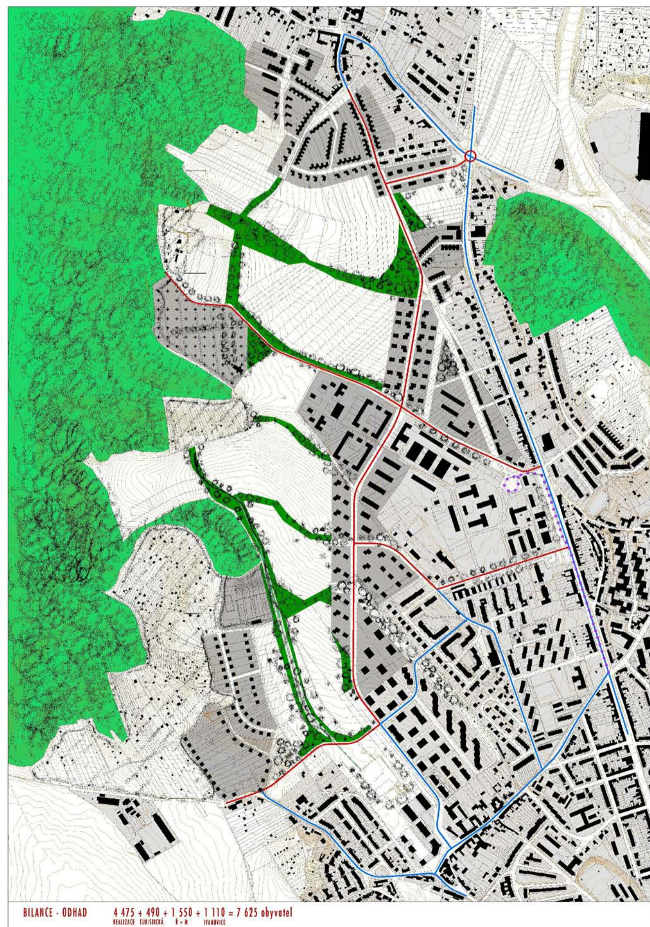
varianta B - prostorové uspořádání