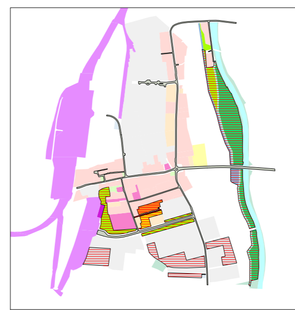
1. etapa výstavby