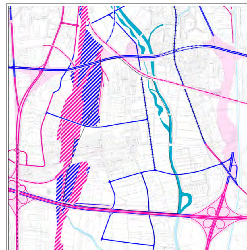
DOPRAVNÍ ŘEŠENÍ - 1 : 25 000 dle ÚPmB