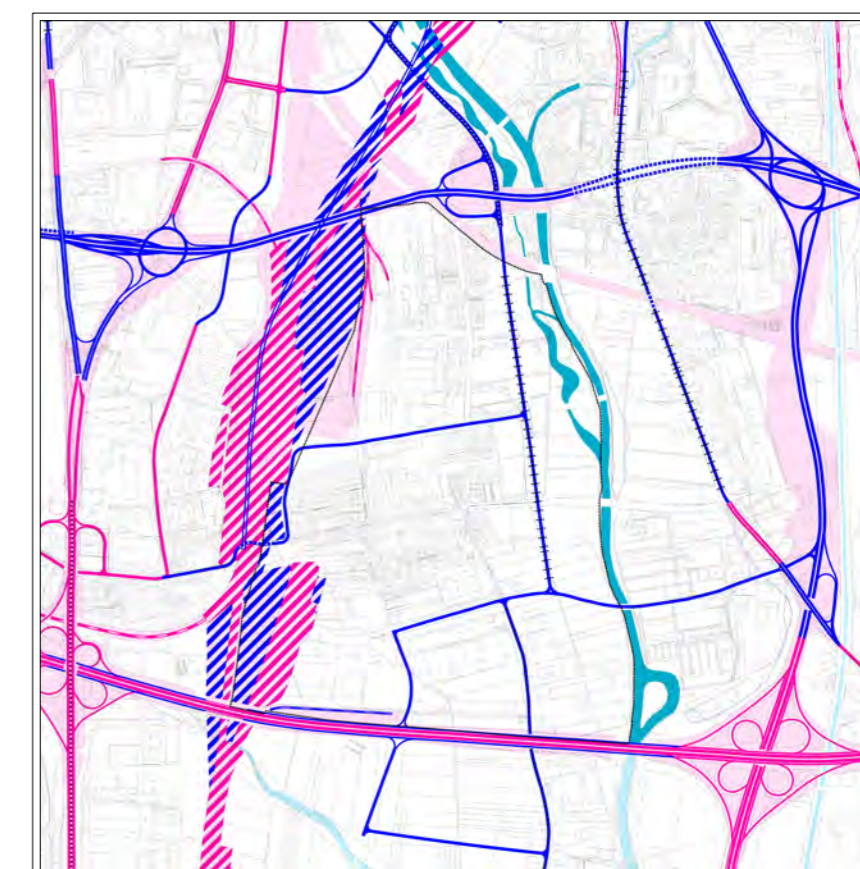
DOPRAVNÍ ŘEŠENÍ - 1 : 25 000 dle změny ÚPmB v souvislosti s přestavbou ŽUB