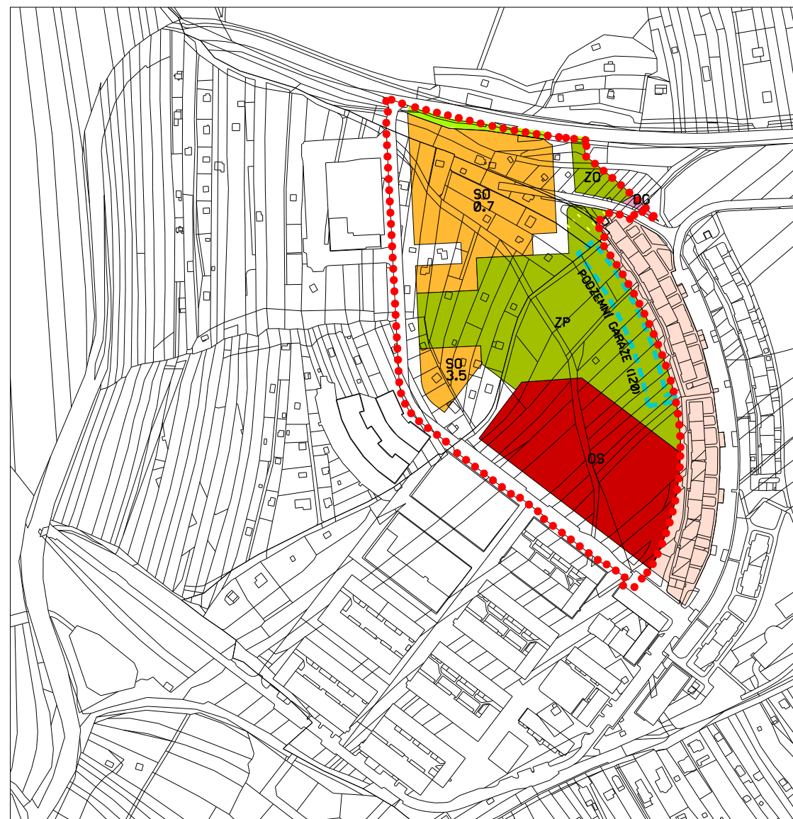
NÁVRH ZMĚNY - ÚPRAVY ÚPmB