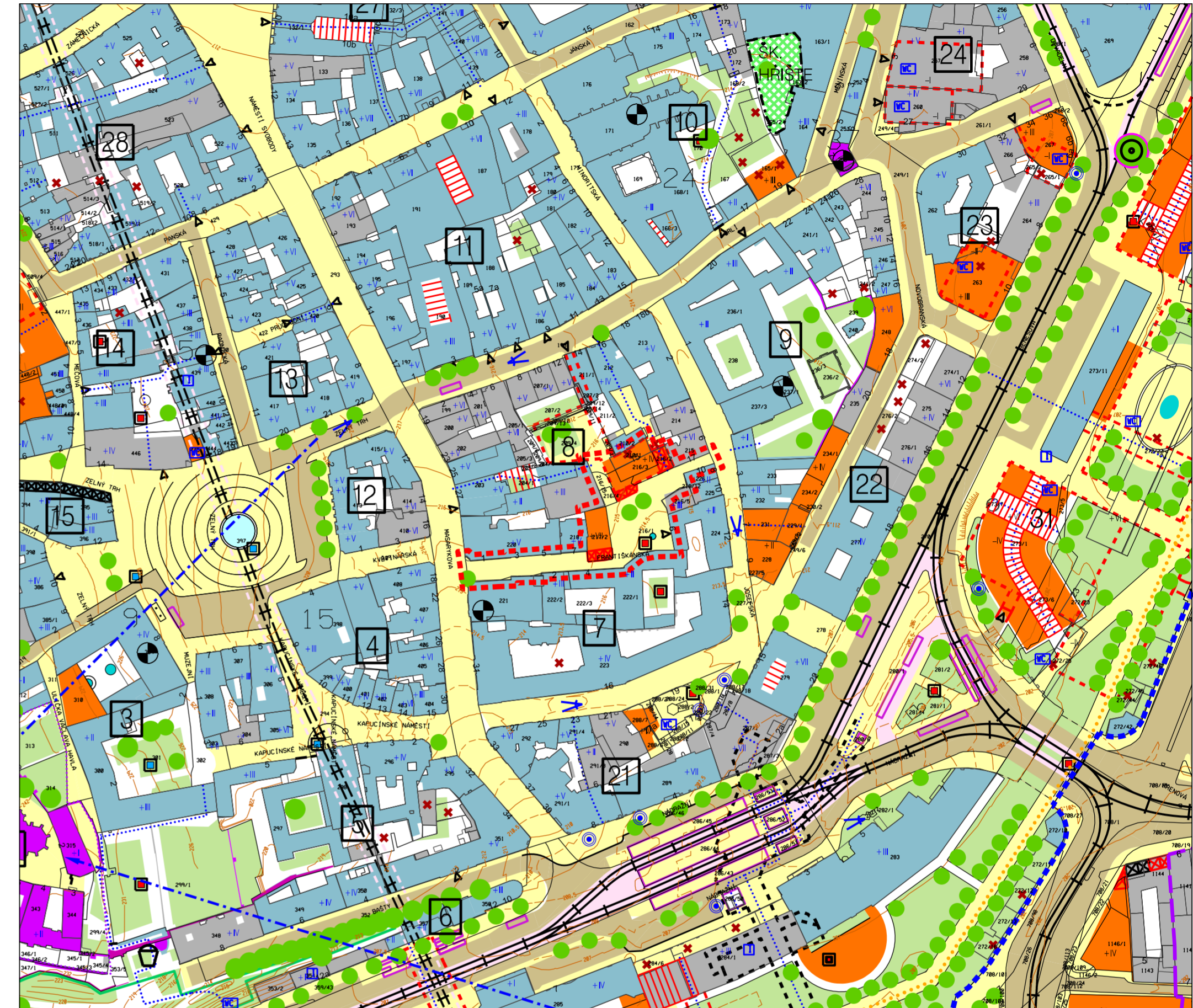
Změna RP MPR Brno RP23/16/Z - Římské náměstí MČ Brno-střed, k.ú. Město Brno