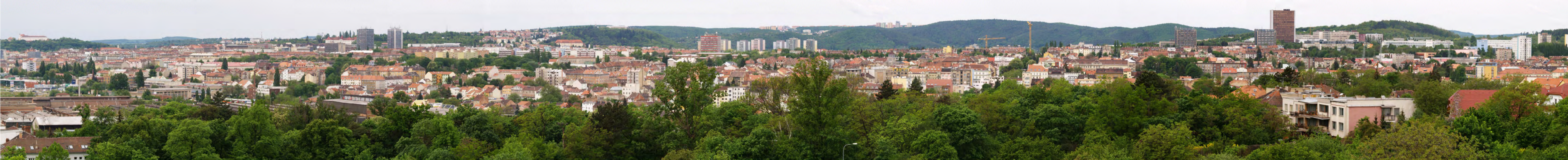
14 - Kociánka - 1. díl PANORAMA PRO POVINNÝ ZÁKRES poloha : X = -597836 Y = -1157071 Z = 291,5 ohnisková vzdálenost: F = 152 mm EQ = 35 mm