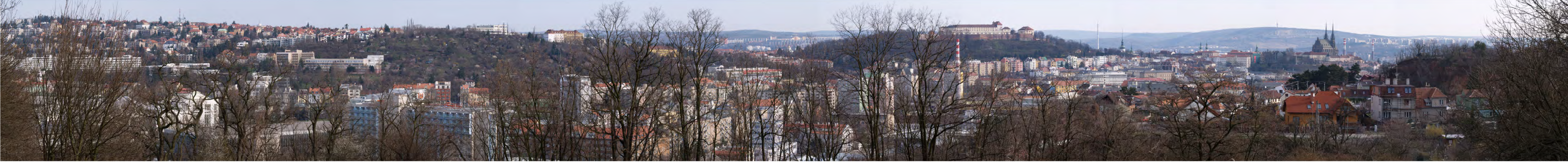
12 - Červený kopec - výstaviště