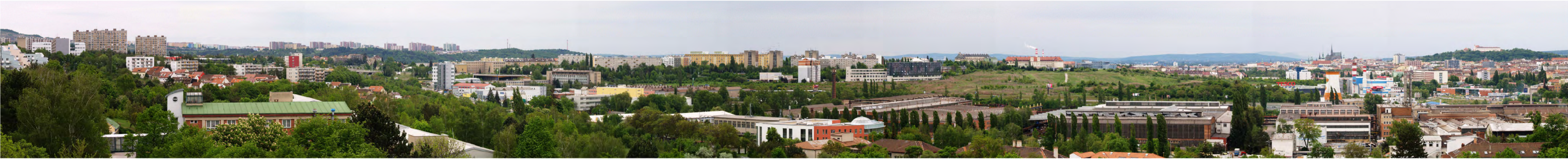
14 - Kociánka - 1. díl PANORAMA PRO POVINNÝ ZÁKRES poloha : X = -597836 Y = -1157071 Z = 291,5 ohnisková vzdálenost: F = 152 mm EQ = 35 mm