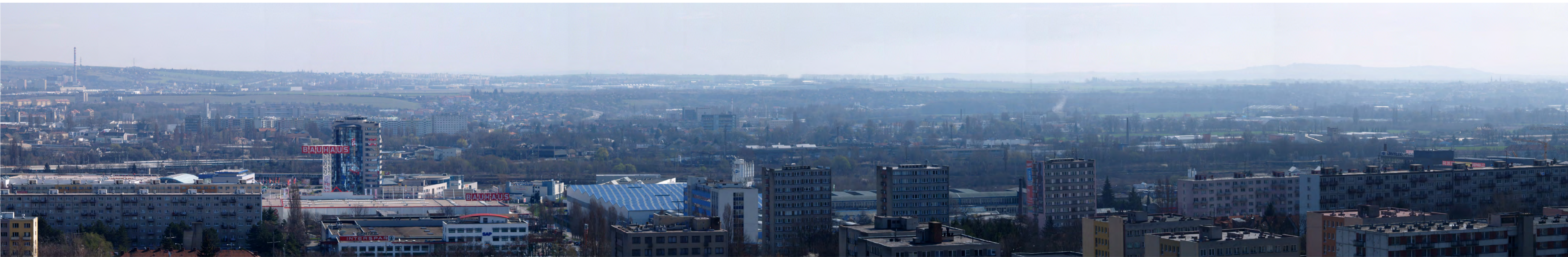
11 - Červený kopec - věznice - 2. díl PANORAMA PRO POVINNÝ ZÁKRES poloha : X = -599978 Y = -1162669 Z = 282,5 ohnisková vzdálenost: F = 192 mm EQ = 35 mm