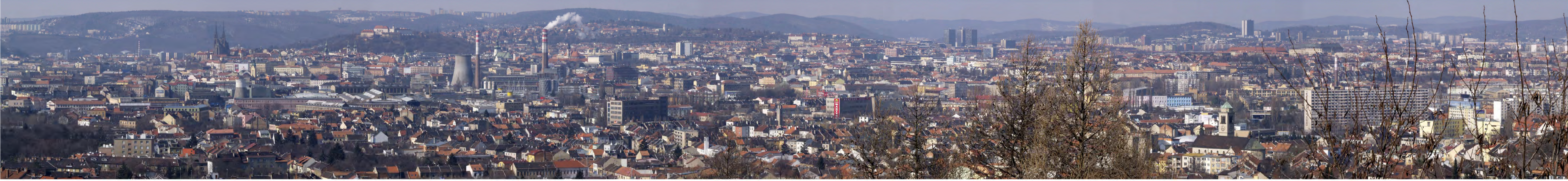
13 - Bílá hora PANORAMA PRO POVINNÝ ZÁKRES poloha : X = -594454 Y = -1161264 Z = 300,5 ohnisková vzdálenost: F = 192 mm EQ = 35 mm