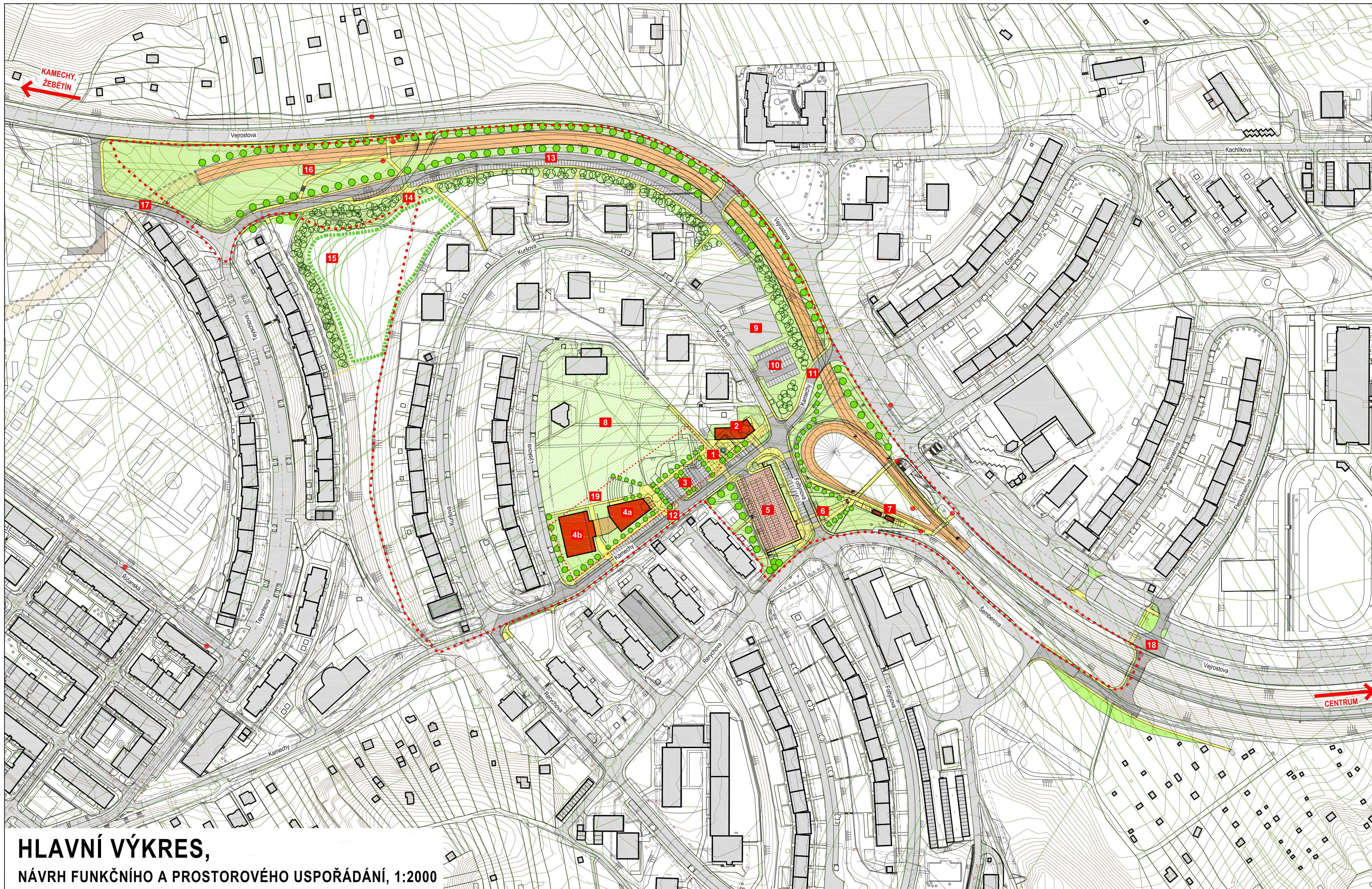
HLAVNÍ VÝKRES, NÁVRH FUNKČNÍHO A PROSTOROVÉHO USPOŘÁDÁNÍ, 1:2000